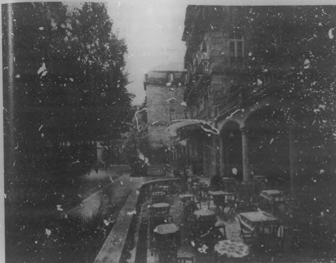
MONDARIZ.—La terraza del Gran Hotel Balneario.

Hemos dado una nueva vuelta por Mondariz. Al acercarse esta época del año, Mondariz es uno de los lugares más concurridos de España al que vienen gentes de Europa y América, atraídas no sólo por el milagro de sus aguas, famosas en todo el mundo, sino también por la maravilla de su paisaje, por las magnificencias incomparables que aquí volcó la mano pródiga de la Naturaleza. Los viajeros acostumbrados a contemplar las bellezas naturales