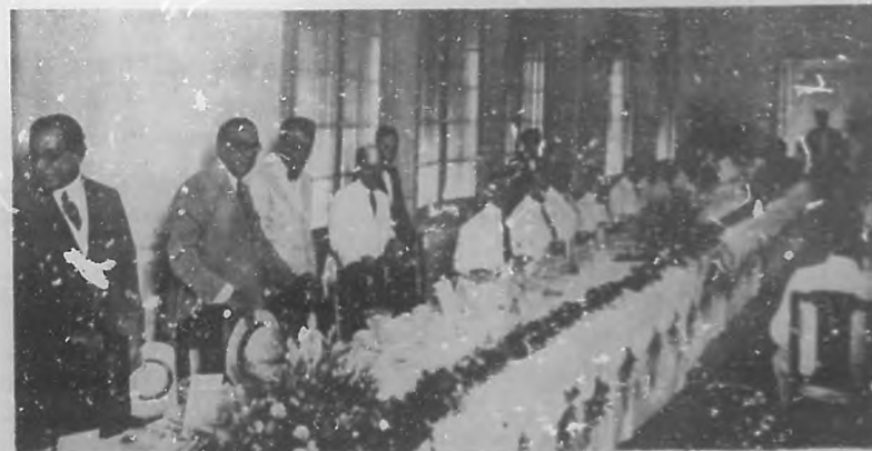
HOMENAJE AL SENADOR BARRERAS. —Aspecto del almuerzo ofrecido por un grupo de amigos y correligionarios al ilustre senador comandante Alberto Barreras, el día 7 del actual en el hotel "Bristol" con motivo de celebrar su santo.—(Foto. Vales.)

patías. Actualmente la mayoría de los liberales matanceros señalan como un muy posible candidato a la Alcaldía de Matanzas en las próximas elecciones, pues con esa designación quieren testimoniarle al doctor Carnot, que no han echado en olvido, los eminentes servicios por él prestados a su Partido y a sus correligionarios.