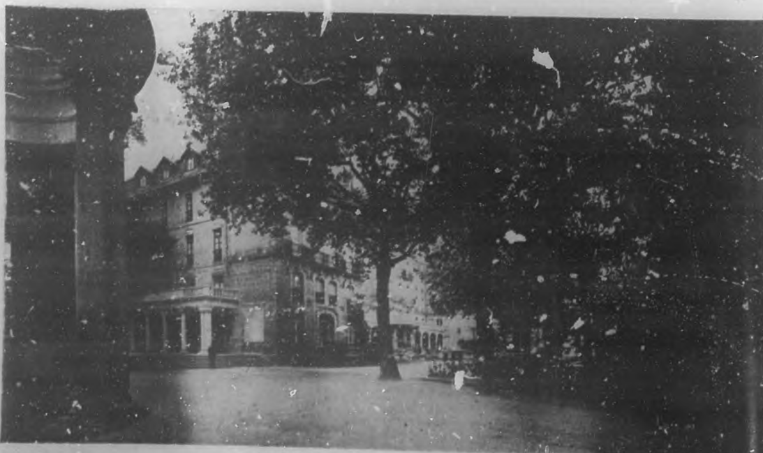
MONDARIZ.—Un aspecto de los jardines.

N. de la R.—Roberto Blanco Torres, el brillante y conocido literato español, que de tan justo prestigio goza tanto en su patria como en la América de habla española, ha reanudado su colaboración en BOHEMIA, enviándonos frecuentemente exquisitas producciones. Con tal motivo hemos recibidos muchas felicitaciones, las que trasmitimos al talentoso y querido compañero para satisfacción suya.