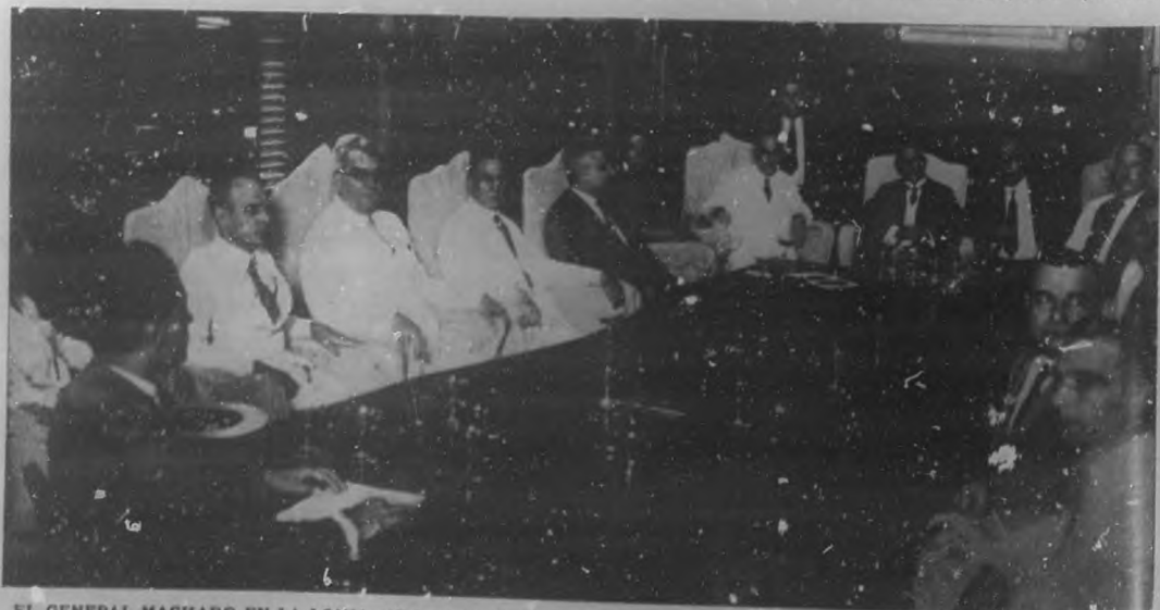
EL GENERAL MACHADO EN LA LOJA. —El honorable Presidente de la República, presidiendo el acto de la cotización durante su reciente visita a la Lonja del Comercio.

portante cargo de Director de Telégrafos, nombramiento con el que se ha sabido premiar sus relevantes merecimientos y excelentes servicios prestados a la Administración Pública.