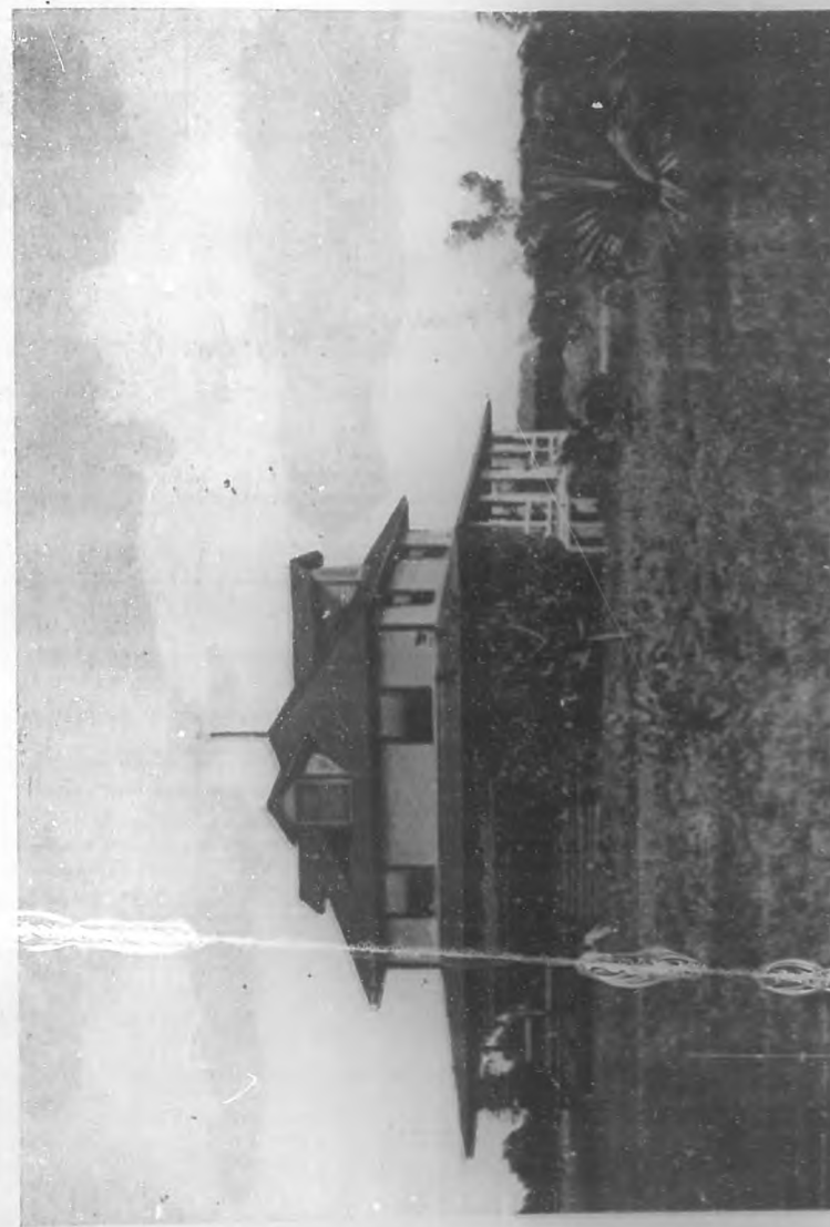
(Grabado taller de BOHEMIA)

Fueron sus antepasados hombres y mujeres anormales, muy inteligentes eso sí y como conscientes todos del estigma ancestral que los perseguía, auto analíticos, artistas, poetas, raros, muchos de los cuales acabaron sus días en manicomios o se privaron de la vida voluntariamente? ¿No lo amenazaba a cada momento ese desequilibrio? La obra benéfica de su vida era precisamente aquella mujer admirable, aquella bondadosa hada surgida de algún jardín excelso de la Felicidad para mitigar su desgracia. Lo cuidaba, lo comprendía, lo guiaba con una intuición divina; por ella estaba vivo, por ella no había dado rienda suelta a sus deseos imperiosos de cometer el mal, de convertirse en el verdugo de esa Humanidad odiada. ¡Hasta sabía la causa de su obsesión como