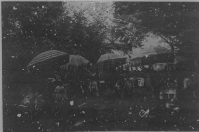
MONDARIZ.—De merienda en Pías.

terinos que repiten, ester vacante su monótono trinar en la canción de amor misteriosa; alondras de alas blancas en las verbenas de las montañas; flores de campo de todo y en todos los colores verdientes como los días de palomas y reposo. Por entre este desfiladero de hermosura, superior al prodigio de la paleta y el pincel de la pintura, se ven los caminos, a tre-