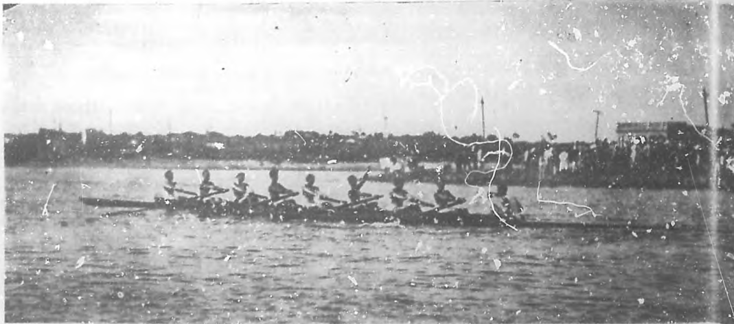
LAS REGATAS DEL DOMINGO EN LA PLAYA DE MARIANAO. —La canoa de ocho remos perteneciente al "Habana Yacht Club", vencedora en la regata de primeras ripulaciones.