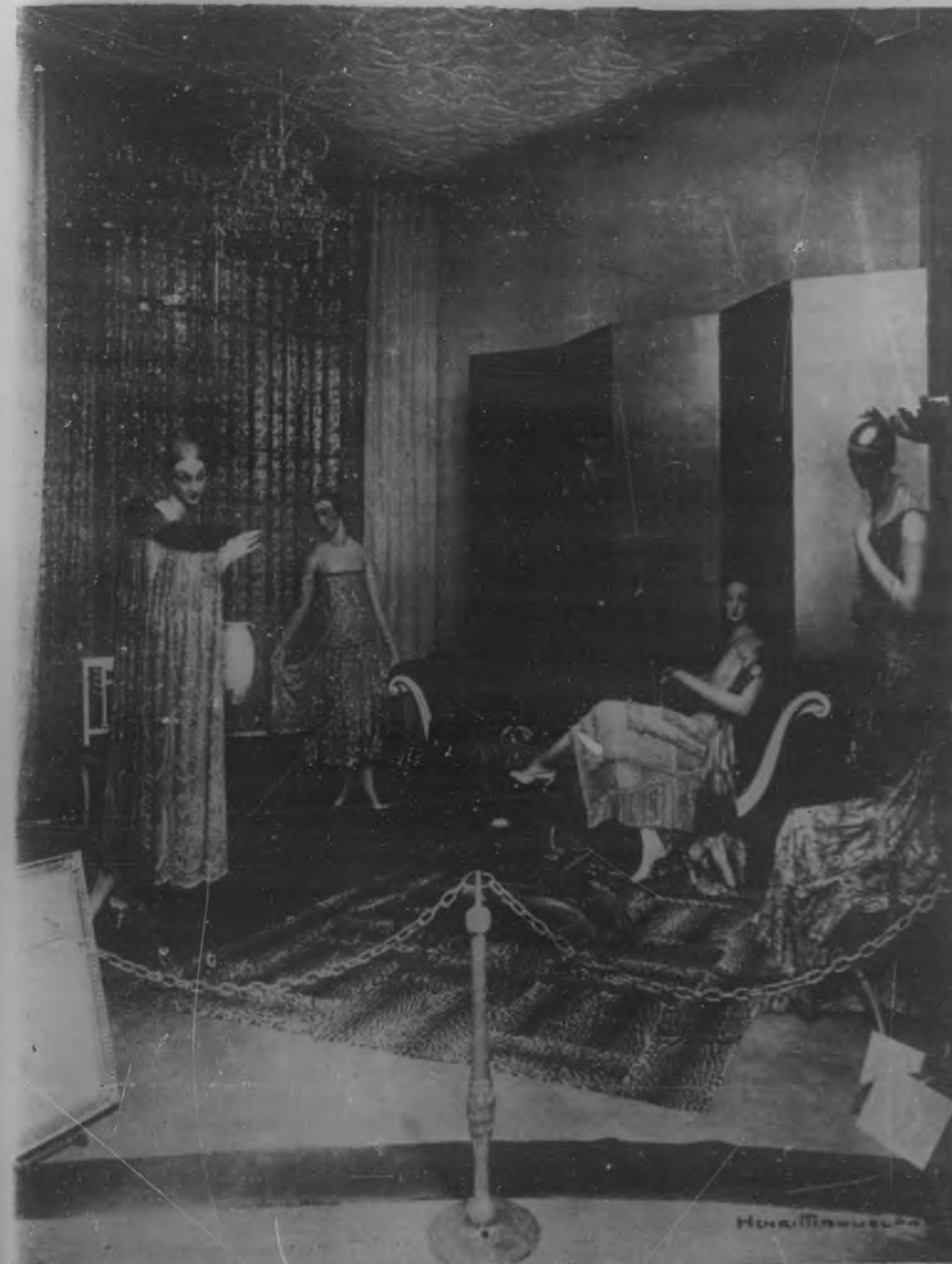
LA EXPOSICION DE ARTES DECORATIVAS.—Bello aspecto que presentaba el escaparate de uno de los grandes modis- tos parisienses que tomaron parte en la Exposición de Artes Decorativas celebrada recientemente en los Campos Eliseos, de Pa- ris, con inusitada brillantez. Algunos de los regios modelos allí exhibidos serán publicados en la revista "Elegancia".

Telefonos: Dirección, M-1322; Adminis- tración, A-5128.