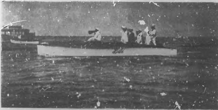
LAS REGATAS DEL DOMINGO EN LA PLAYA DE MARIANAO. —El honorable Sr. Presidente de la República, en compañía de un grupo de amigos, aclamando a la canoa vencedora.