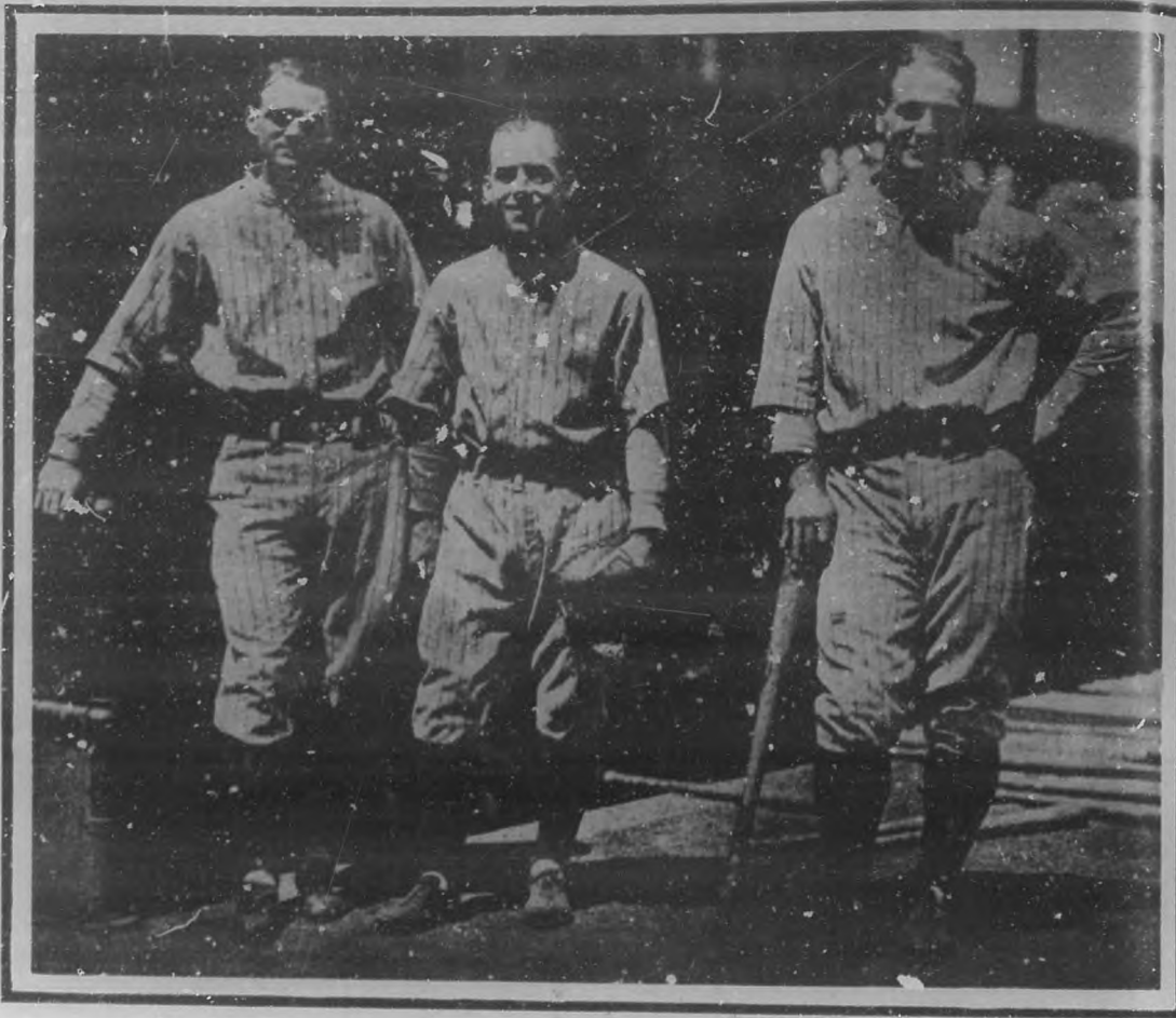
Nuevos jugadores reclutados por los "Yankees" que están portándose heroicamente en los presentes desafíos. De izquierda a derecha: Earl Coombs, Benny Bengough y Lou Gehrig.