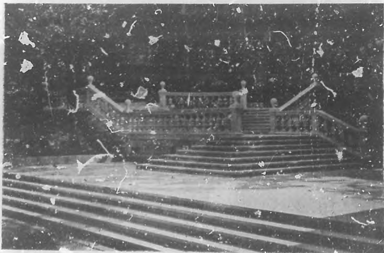
MONDARIZ.—Escalinata que da acceso al bosque.

Cerca, a la margen de un paseo delicioso, festoneado por largas hileras de álamos, a orillas del Tea, que se desliza blandamente con el regocio voluptuoso del que camina entre caricias y halagos, entre mimos de los abedules que se inclinan para mirarse en su linfa y entre besos de la ribera, surge el manantial de Troncoso, la otra fontana melliza que comparte con la de Gándara el sortí-